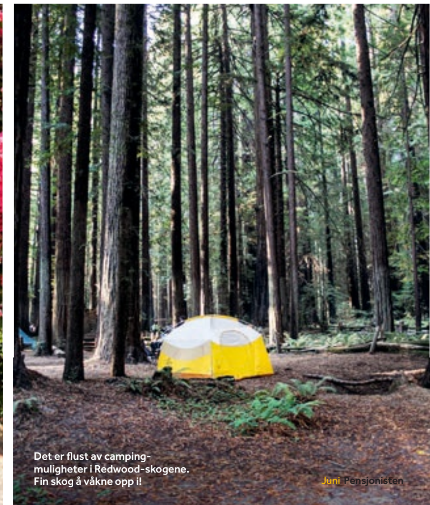
Det er flust av campingmuligheter i Redwood-skogene. Fin skog å våkne opp i!