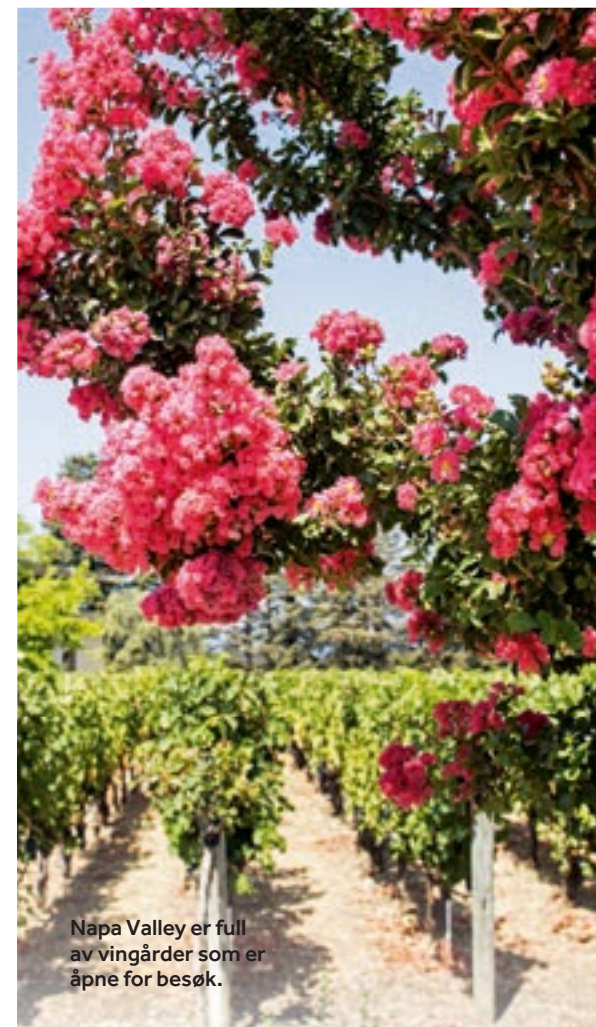
Napa Valley er full av vingårder som er åpne for besøk.