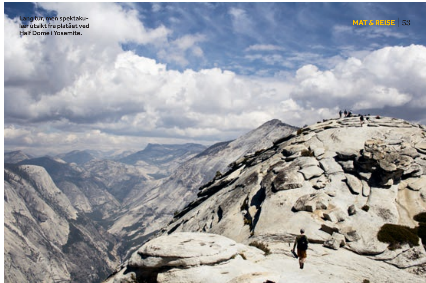
Lang tur, men spektakulær utsikt fra platået ved Half Dome i Yosemite.